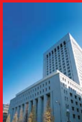
Tòa nhà trụ sở Dai-ichi Life tại Tokyo, Nhật Bản

Với hơn 100 năm kinh nghiệm trong lĩnh vực BHNT và tiềm lực tài chính vững mạnh, Dai-ichi Life đã mở rộng mạng lưới hoạt động ở nhiều quốc gia trên thế giới như Việt Nam, Ấn Độ, Thái Lan và Úc. Kể từ khi được thành lập, Dai-ichi Life hoạt động dựa trên nền tảng "Khách hàng là trên hết" và triết lý kinh doanh này luôn được phát huy nhằm thực hiện cam kết trở thành người bạn đồng hành đáng tin cậy trọn đời của khách hàng.